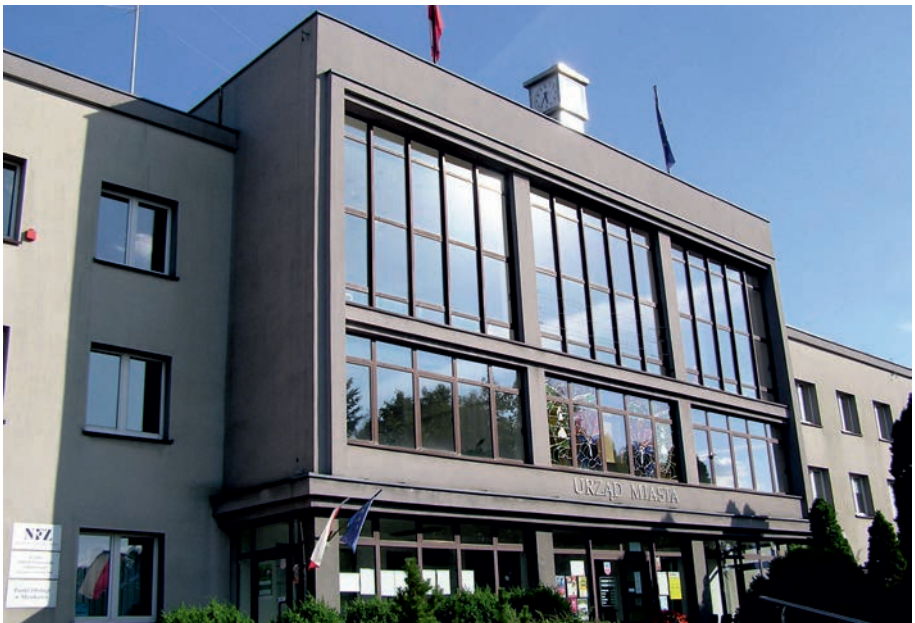
Myszków - Urząd Miasta.