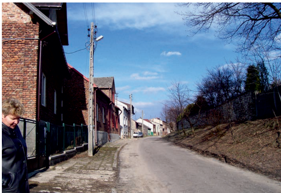
Myszków - ul. Poniatowskiego, dawna ul. Kępska.