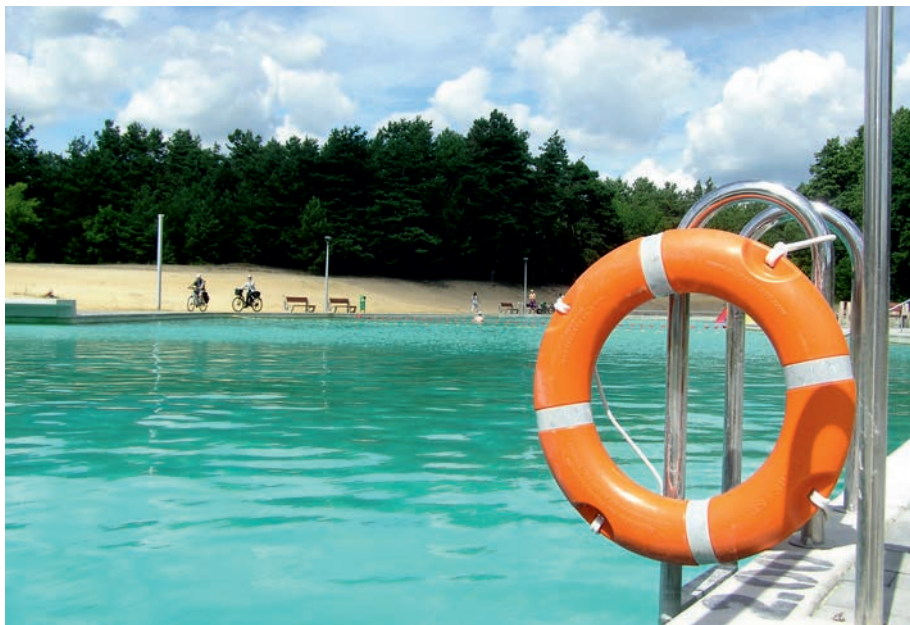
Żarki - basen kąpielowy.