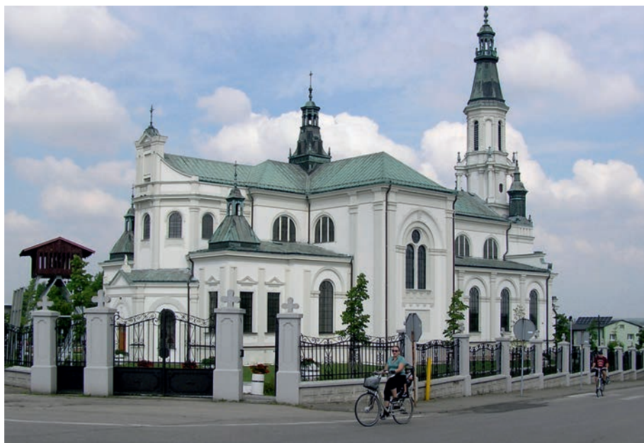
Koziegłówek - kościół pw. św. Antoniego Padewskiego.