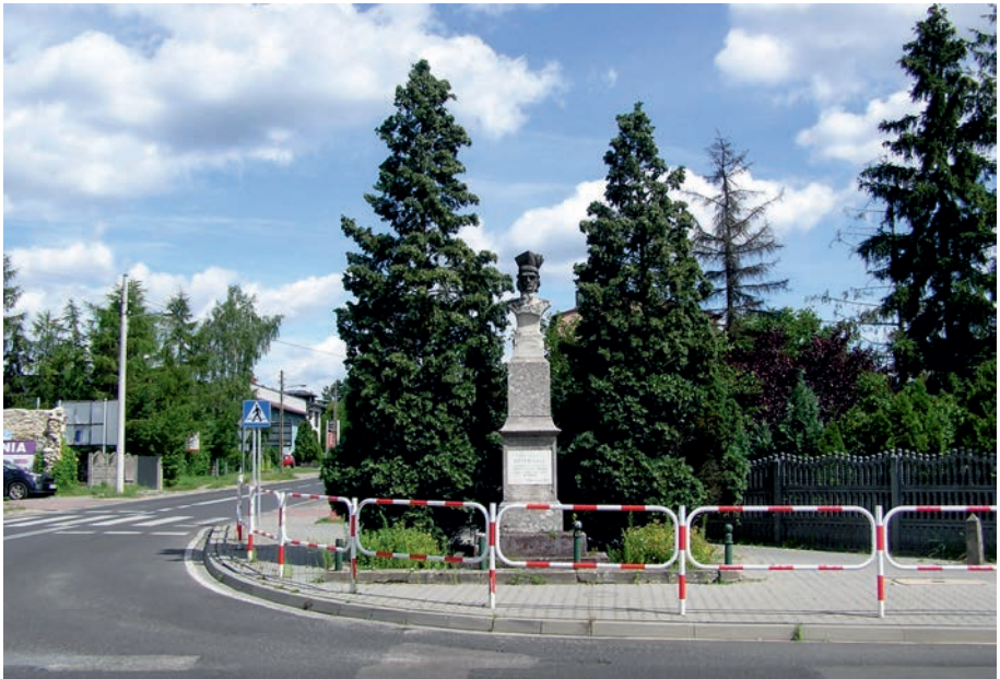
Żarki - pomnik T. Kościuszki.