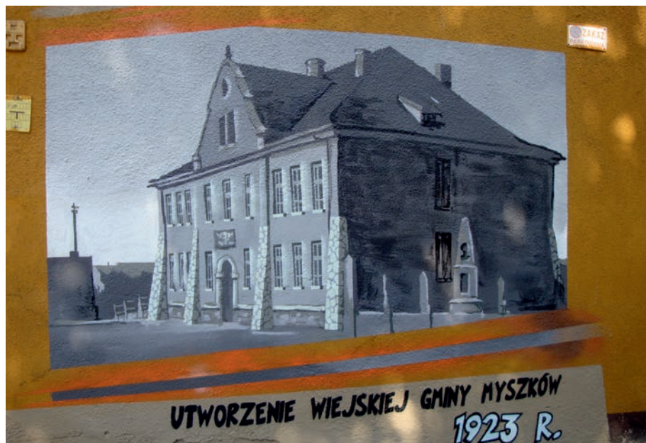
Myszków - mural historyczny.