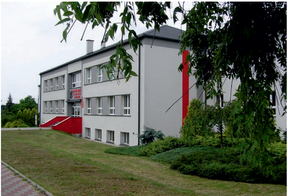
Żarki - LO.