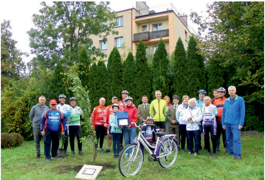
Myszków - Drzewo dziedzictwa 70-lecia PTTK.