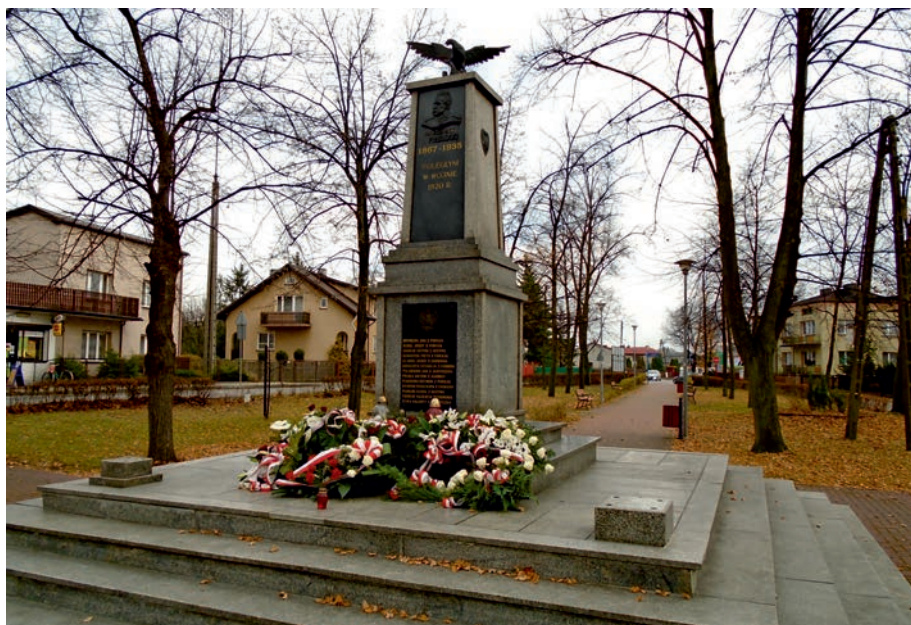
Poraj pomnik marsz. J. Piłsudskiego.