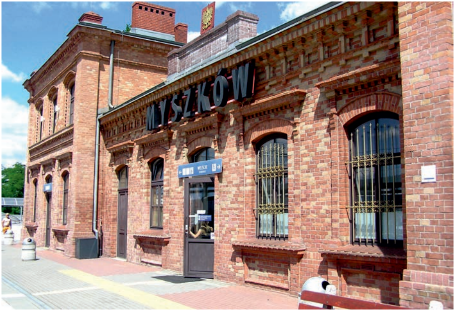
Myszków - dworzec kolejowy.