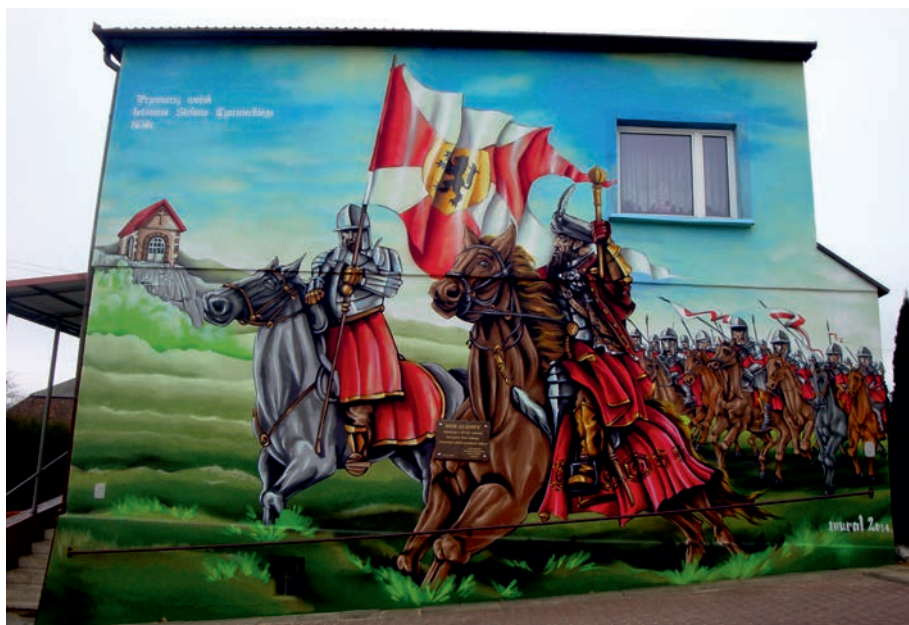
Myszków Będusze - mural obrazujący "potop".