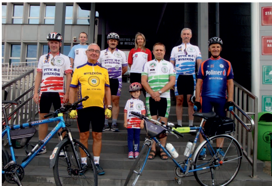
Turyści PTTK "M-2" w strojach klubowych.