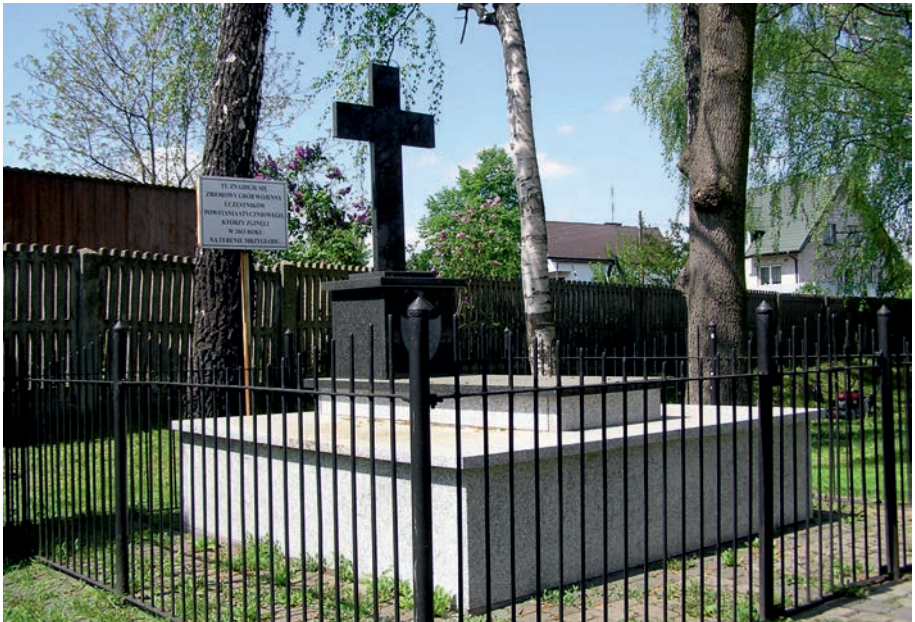
Myszków - grób powstańców 1863 r. w Mrzygłodzie.