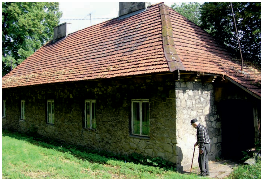
Myszków Będusz - folwarczne czworaki.