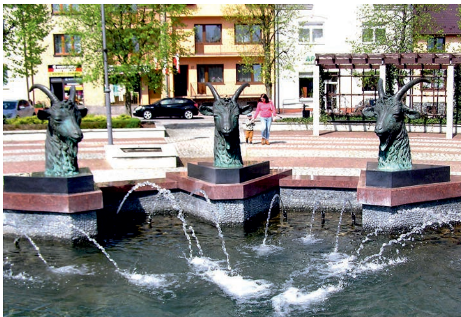
Koziegłowy - fontanna na pl. Moniuszki.