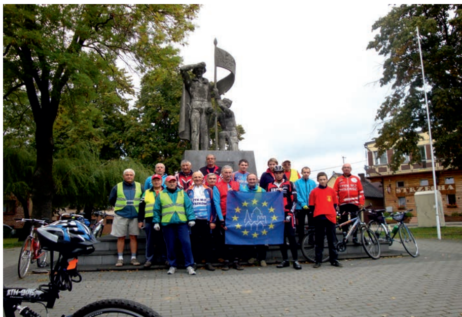
Myszków Mrzygłód - rajd EDD 2013 r.