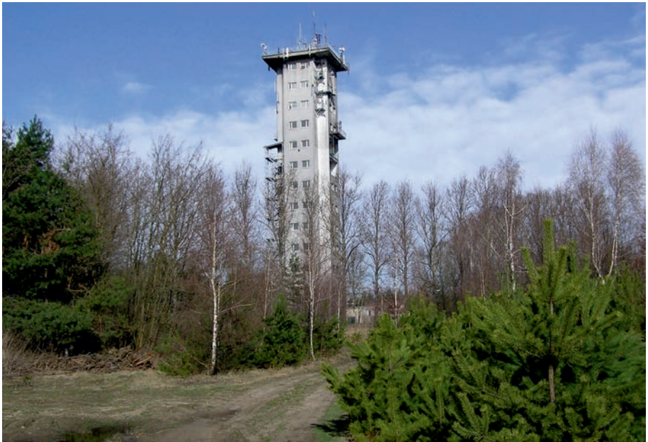
Niegowa - wieża przekaźnikowa.