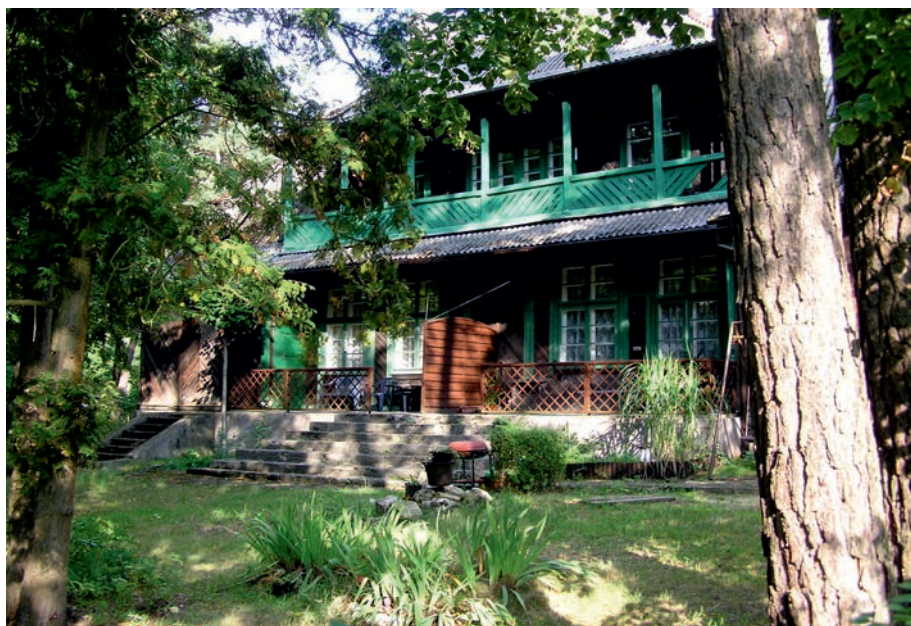
Żarki Letnisko - willa "Nałęcz"