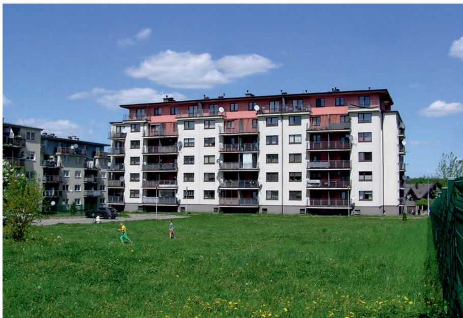
Myszków - osiedle MTBS.