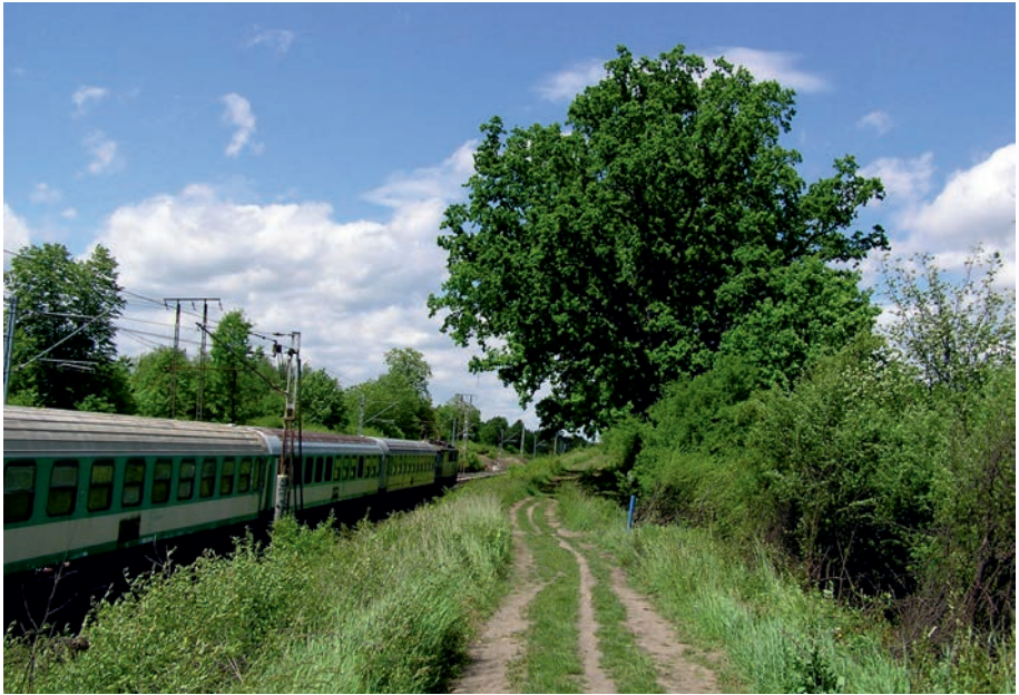
Myszków - dęby pomniki przyrody.