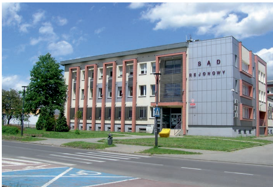
Myszków - Sąd Rejonowy.