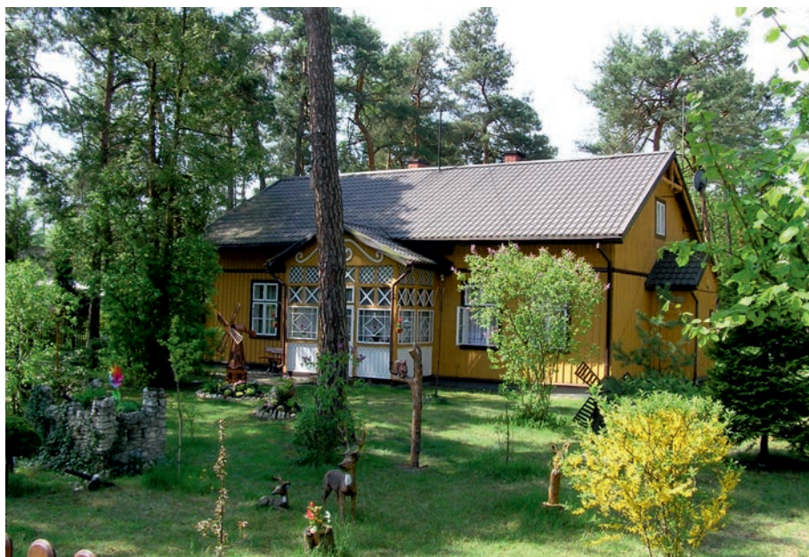
Żarki Letnisko - fragment dawnej zabudowy.