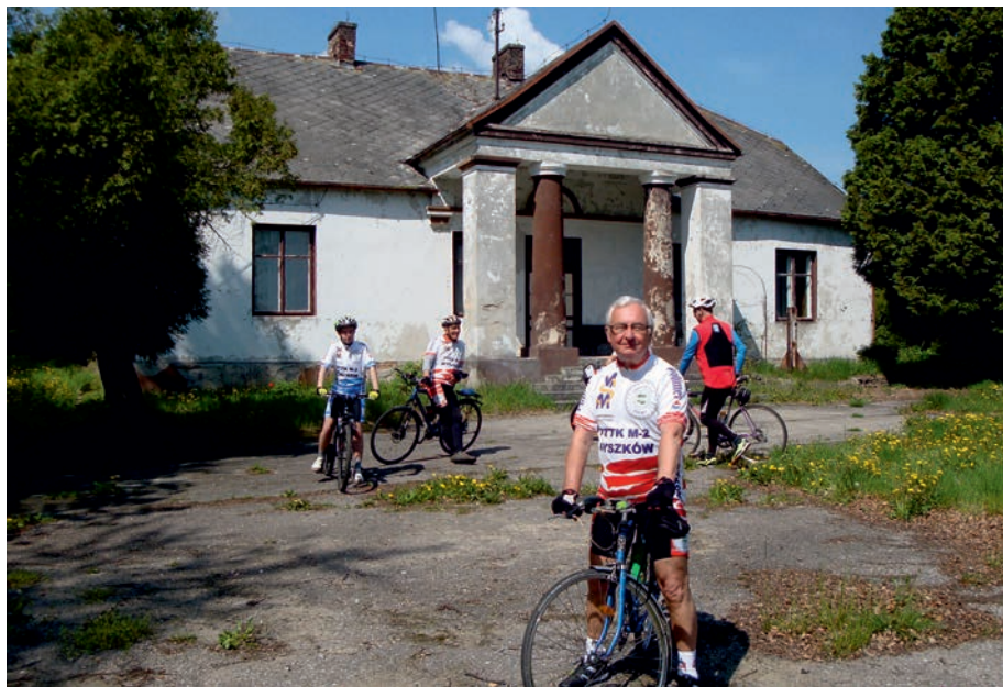
Mzurów - dwór.