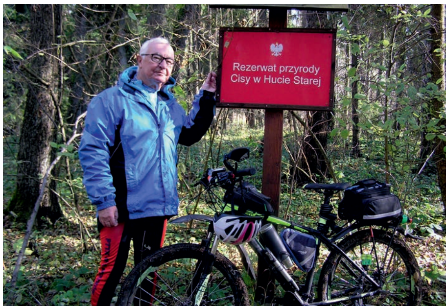
Rezerwat cisów w Hucie Starej.