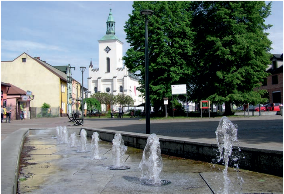
Żarki - fontanna na Starym Rynku.