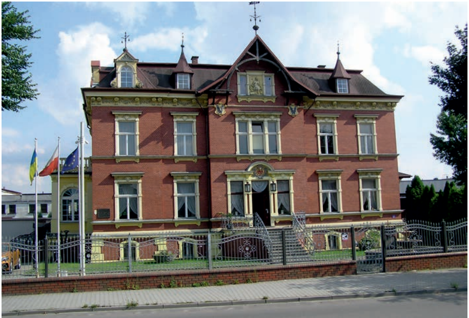
Myszków - pałac braci Schmelzer.