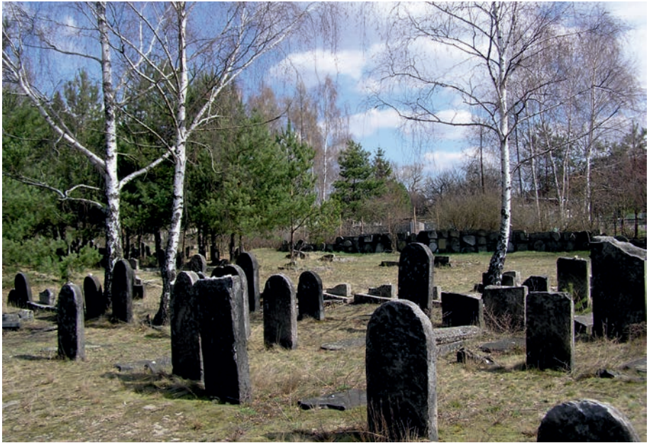
Żarki - kirkut.