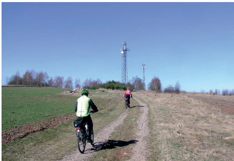
Markowice - Góra Trzech Rzek.