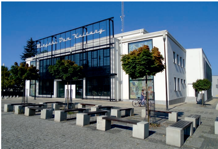
Myszków - Miejski Dom Kultury.