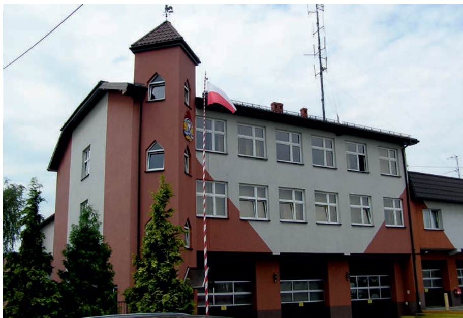
Myszków - Komenda Zawodowej Straży Pożarnej.