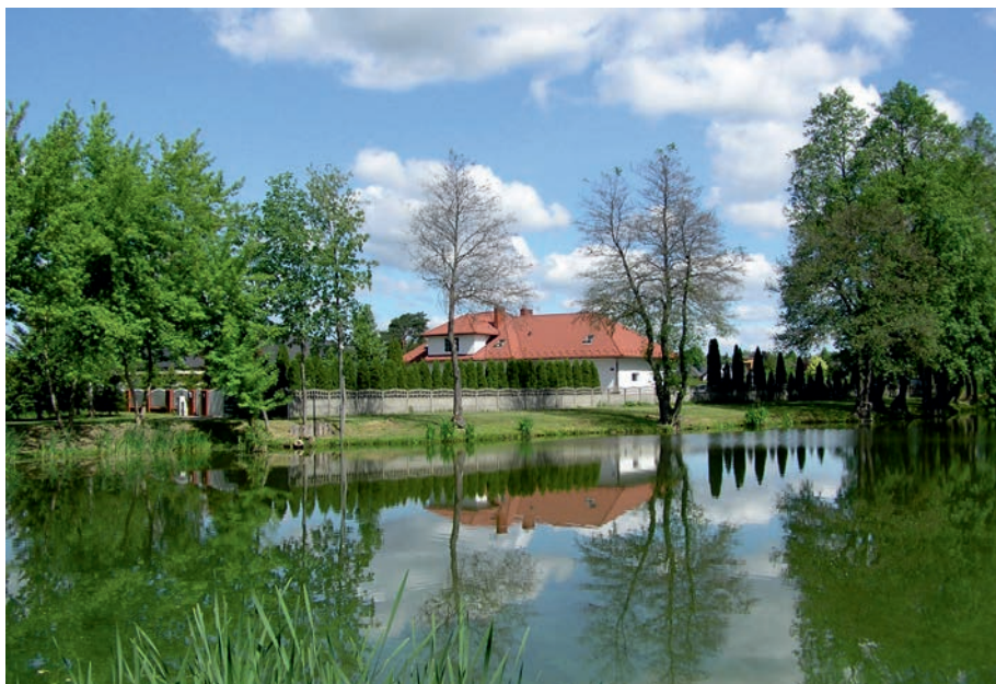
Żarki - współczesna willa.