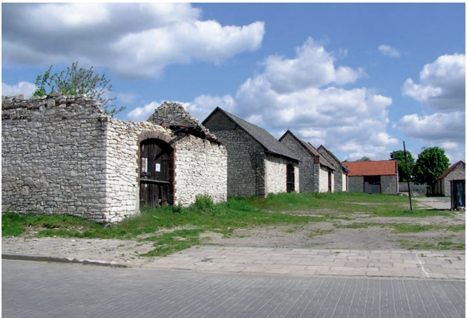
Żarki - zabytkowe stodoły.