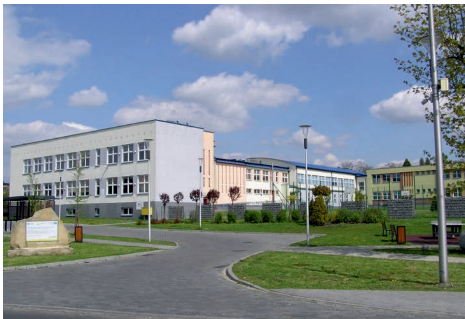
Zespół Szkół w Koziegłowach.