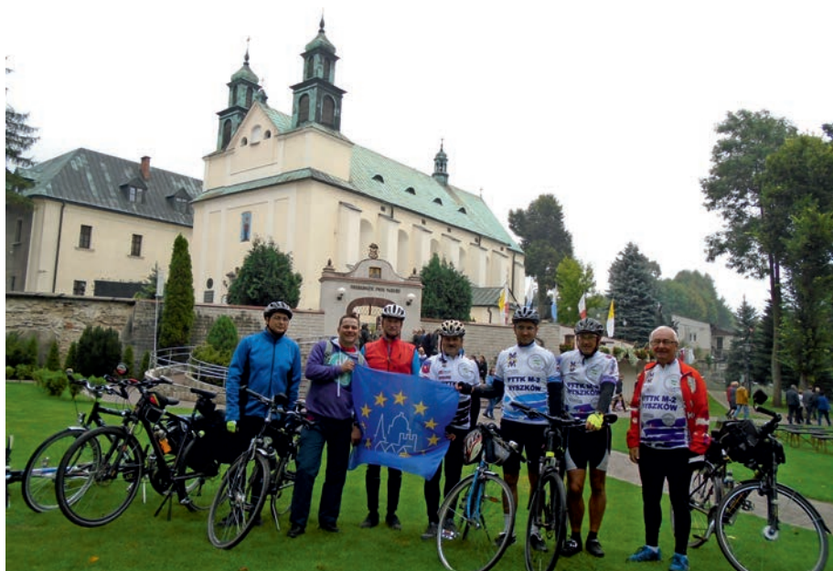
Żarki Leśniów - rajd EDD w 2016 r.