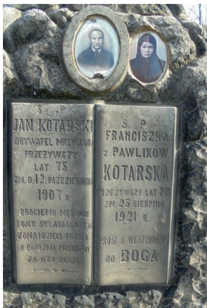
Nagrobek obywatela Mrzygłodu z 1907 r.