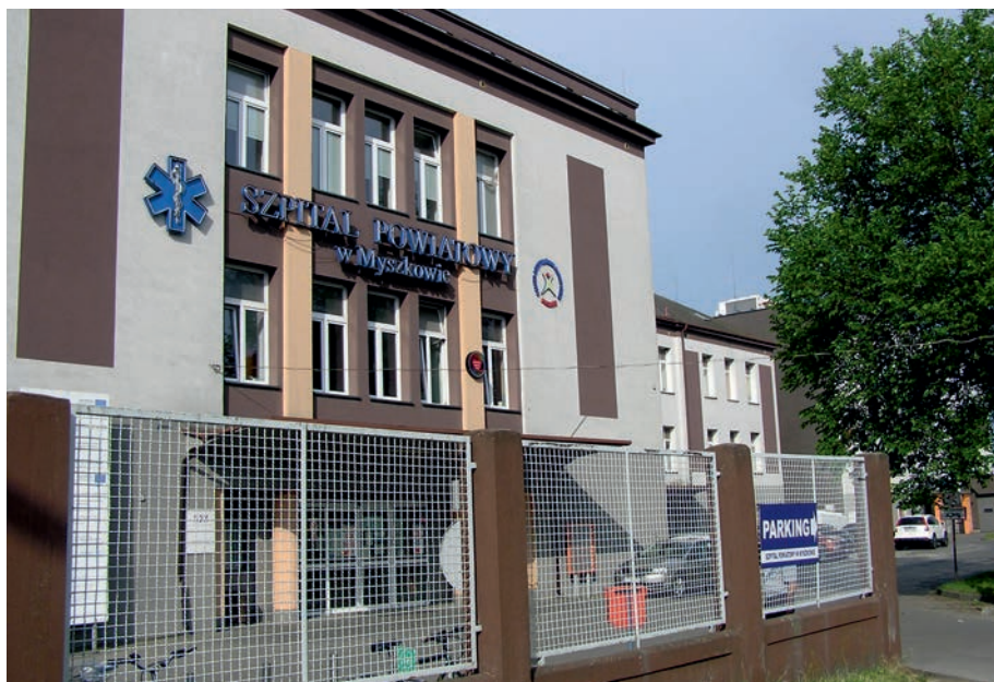
Myszków - Szpital powiatowy.