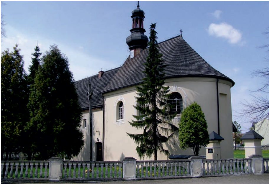
Koziegłowy - kościół pw. św. Barbary.