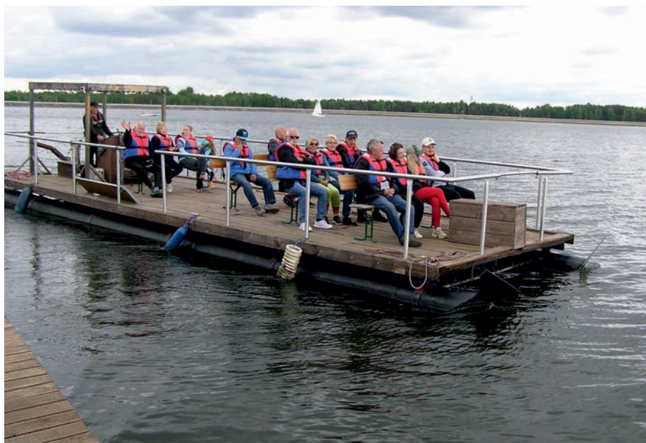
Zalew "Poraj" - łajba wycieczkowa