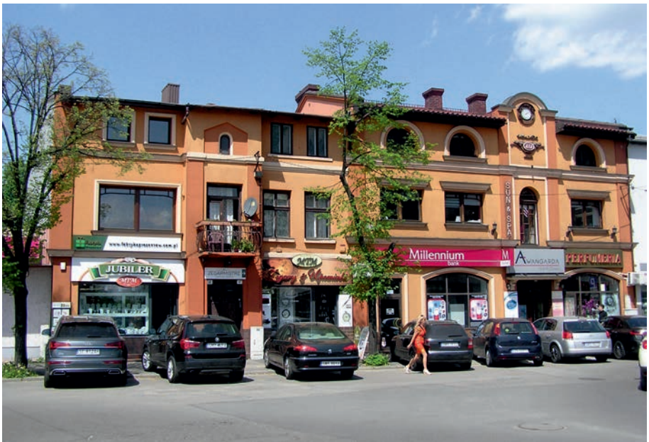
Myszków - centrum miasta.