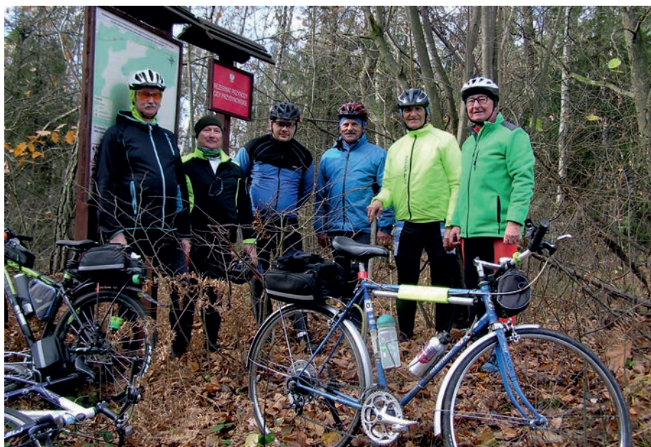
Rezerwat cisów w Kępinie.