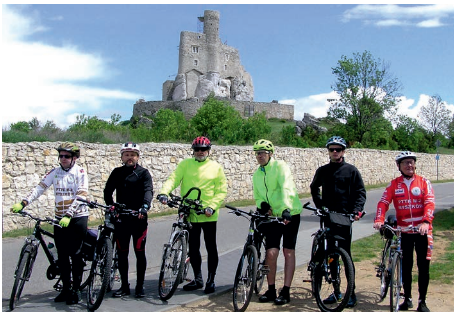
Mirów - zamek na szlaku Orlich Gniazd.