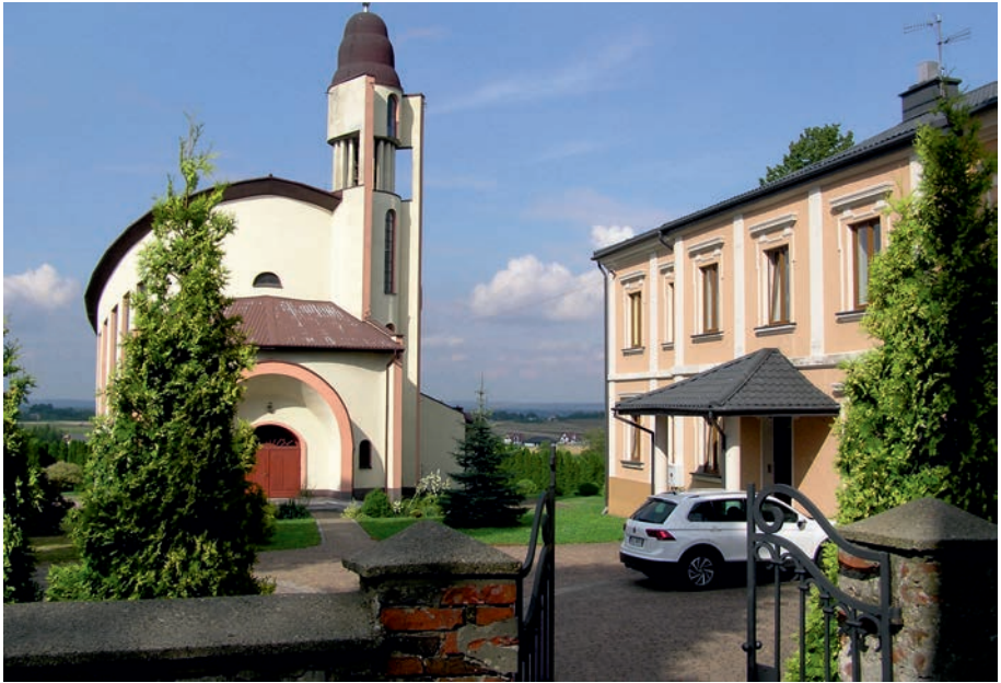
Pińczyce - dawny pałac, obecnie plebania.