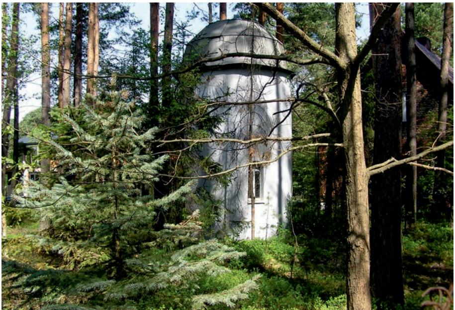
Żarki Letnisko obserwatorium astronomiczne.