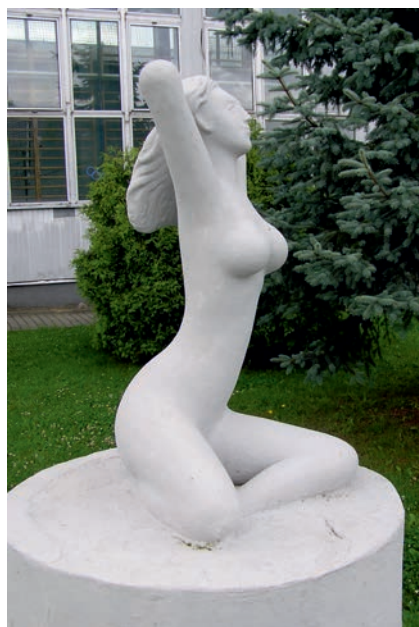
Myszków - rzeźba parkowa.