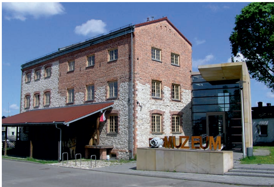
Żarki - Muzeum dawnych rzemiosł.