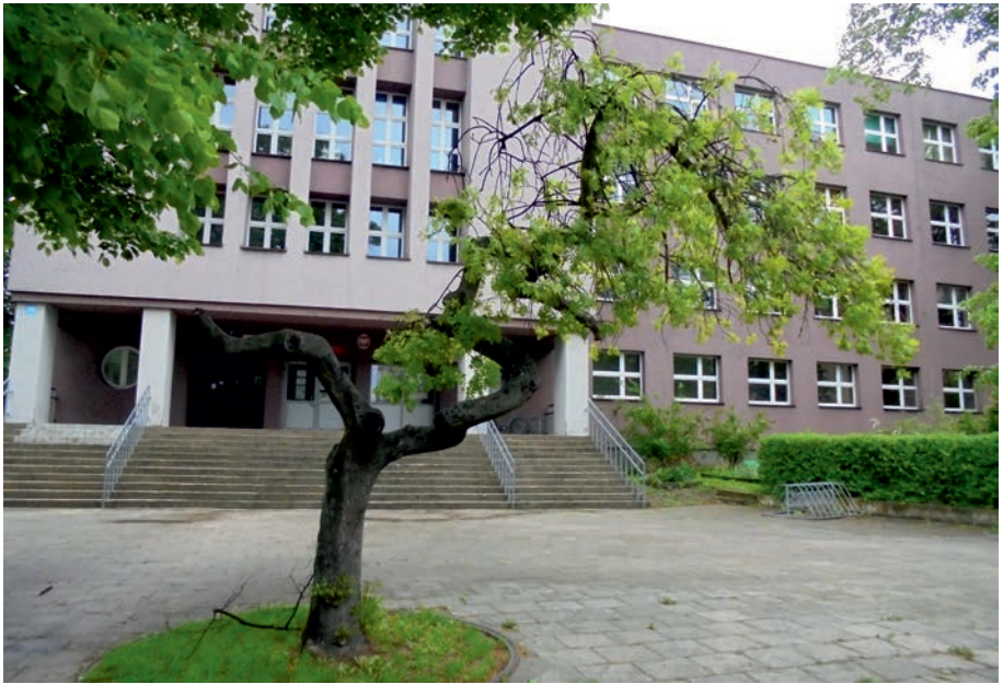
Myszków - Szkoła Podstawowa nr 3.