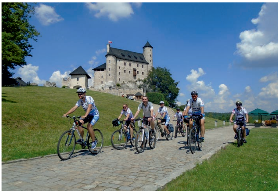
Bobolice - odbudowany zamek.