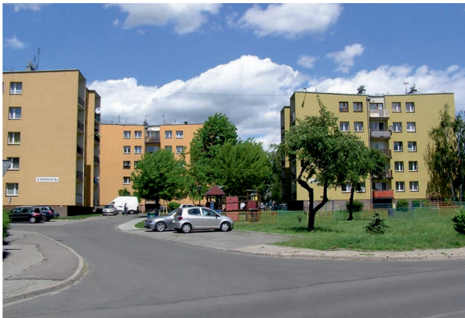
Myszków - osiedle Myszkowskiej Sp-ni Mieszkaniowej.