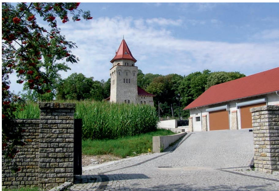
Myszków Będusz - dawny folwark.