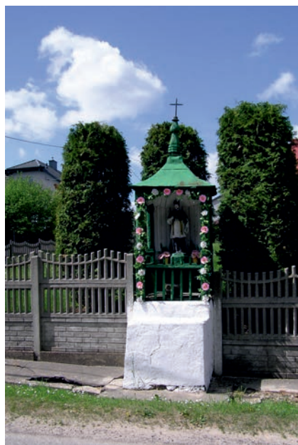
Pińczyce - kapliczka św. Jana Nepomucena.